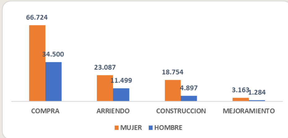
Gráfica N°2: Déficit Habitacional Desagregado por Preferencia

En relación con la gráfica N° 2, se puede observar que la preferencia “compra de viviendas”, representa el mayor porcentaje, equivalente a 101.224 personas inscritas, de estas el 66% corresponde a mujeres.