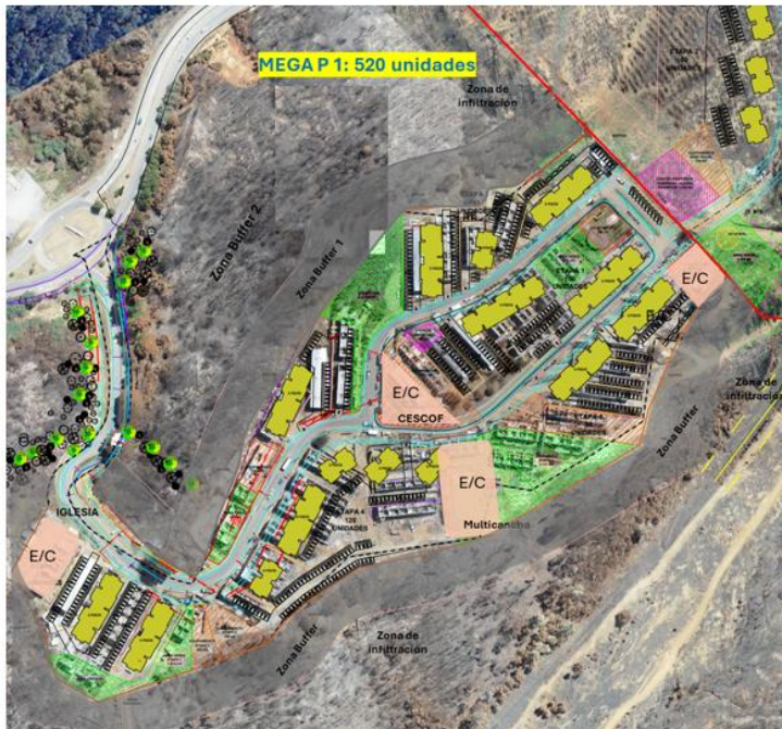
Imagen Nº 11: Equipamientos y cesiones obligatoria a considerar en el diseño