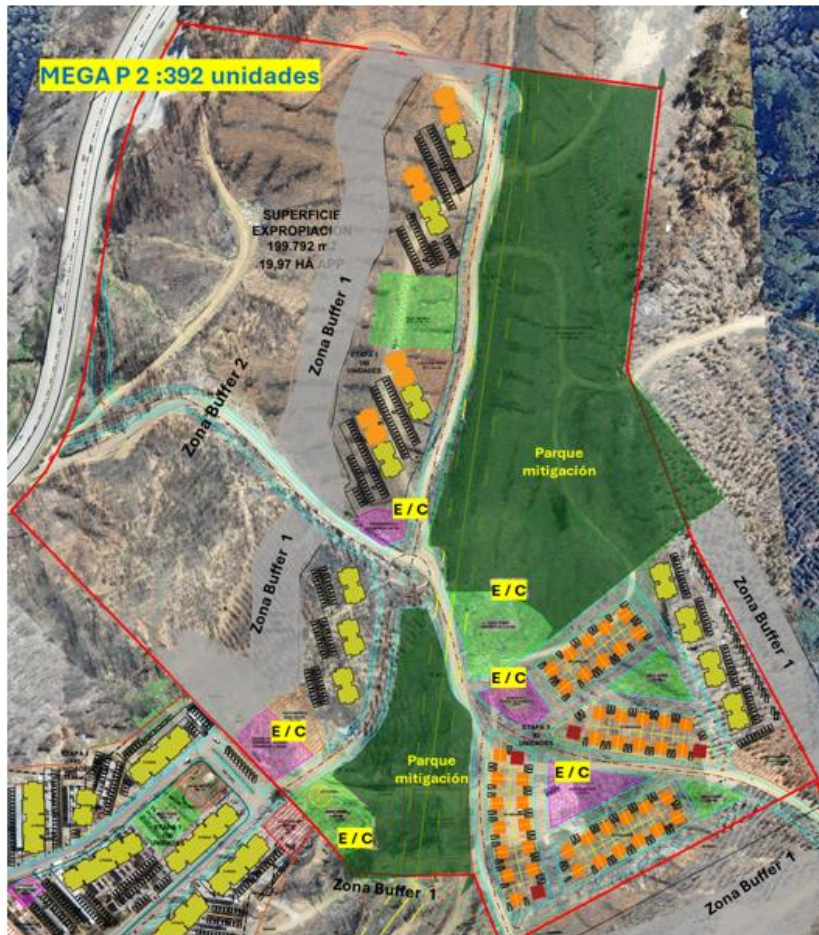
Imagen N° 12: Equipamientos y cesiones obligatoria a considerar en el diseño