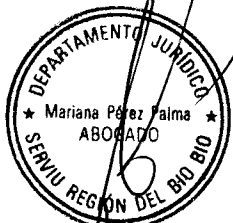
SECRETARIO MINISTRO DE FE SERVICIO DE VIVIENDA Y URBANIZACION REGION DEL BIO BIO

Lo que Transcribo a Usted para los fines consiguientes